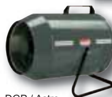
DGP / Astro